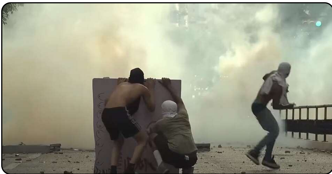
Manifestations contre la réélection de Nicolás Maduro, 30 juillet 2024

Après les élections, la communauté internationale s'est montrée divisée. Certains pays, comme les États-Unis, l'Argentine, le Salvador ou plusieurs membres de l'Union européenne, ont exprimé leur soutien à Edmundo González, qu'ils considèrent comme le président légitime. D'autres, en revanche — comme la Chine, la Russie ou l'Iran — ont refusé de reconnaître les irrégularités du scrutin et continuent d'entretenir des relations étroites avec le régime de Maduro.