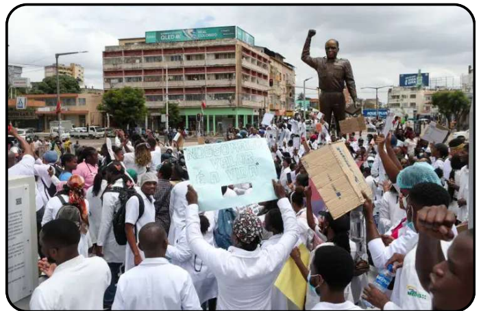
5 novembre 2024, Maputo

Les manifestants ont libéré des prisonniers, mis à sac un complexe hôtelier appartenant à l'ancien président, et détruit des statues de figures emblématiques du régime.