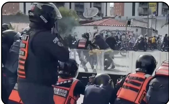
Les forces de police tirent sur les manifestants au Venezuela en juillet 2024

Des vidéos diffusées par des ONG montrent des policiers frappant violemment des manifestants à terre, tandis que des témoignages dénoncent l'usage de la torture dans les prisons pour faire avouer des crimes fictifs aux militants de l'opposition.