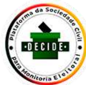
Logo de l'ONG Plataforma Decide

En 2023, ses observateurs ont couvert plus de 60 % des bureaux de vote de Maputo, permettant de comparer les résultats officiels avec ceux constatés localement. La plateforme a également documenté 42 cas d'intimidation ou d'arrestation de militants civiques durant le processus électoral de 2023, souvent liés à la publication de contenus critiques en ligne.