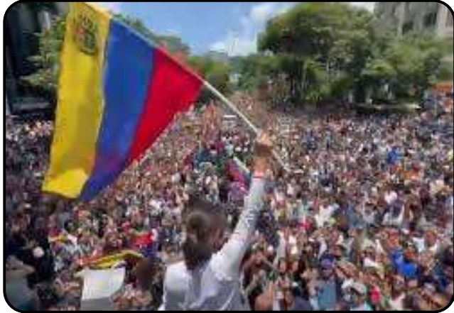
Caracas, le 4 août 2024

Au Venezuela, les manifestations de 2024, déclenchées par une énième élection présidentielle entachée de fraudes, ont mobilisé des milliers de personnes dans les rues de Caracas, et à travers toutes les principales villes du pays. Selon les chiffres compilés par l'Observatorio Venezolano de Conflictividad Social (OVCS), 915 manifestations contre les résultats des élections ont été signalées, réparties dans tout le pays. Ces rassemblements ont mobilisé des centaines de milliers de personnes.