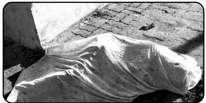
Photo extraite d'un rapport de l'ONG Plataforma Decide sur les manifestations entre octobre 2024 et mars 2025

Les deux figures de proue de l'opposition, María Corina Machado et Edmundo González, vivent dans la clandestinité, visés par des accusations d'« incitation à l'insurrection » ou d'« association de malfaiteurs ». Les arrestations massives sont légitimées par des lois sujettes à interprétation contre le « fascisme » ou la « haine » pour menacer les ONG, museler les médias critiques et justifier la répression. Les détenus font face à des accusations graves, de « terrorisme » ou d'« incitation à la haine », passibles de lourdes peines de prison. Certains militants ont été envoyés dans des prisons connues pour leurs conditions inhumaines, où la torture et les mauvais traitements sont monnaie courante.