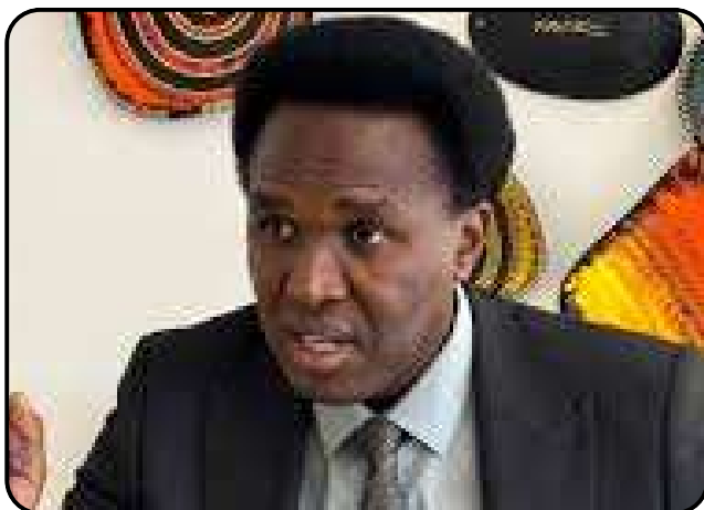
Venâncio Mondlane, le 5 janvier 2024

Venezuela et Mozambique Quand les armes ont raison de la mobilisation populaire