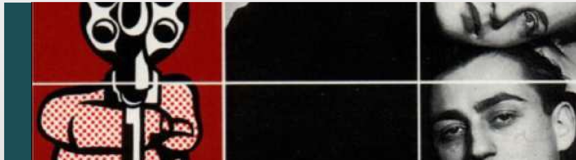
Première de couverture - Les Mains Sales - Jean-Paul Sartre

Chaque mesure de rétorsion du régime en place doit lui coûter cher politiquement, sur le plan international. L'usage non légitime et disproportionné de la violence par un mouvement civique, hors du cadre défini ci-dessus, risque d'isoler celui-ci d'une base populaire large et d'offrir aux forces répressives une licence pour répondre par une violence encore plus décomplexée. Son succès, au contraire, dépend de sa capacité à rassembler le plus largement possible, parmi ses concitoyens et au-delà des frontières. Il doit rendre incontestable la légitimité de sa lutte et des moyens qu'il emploie.