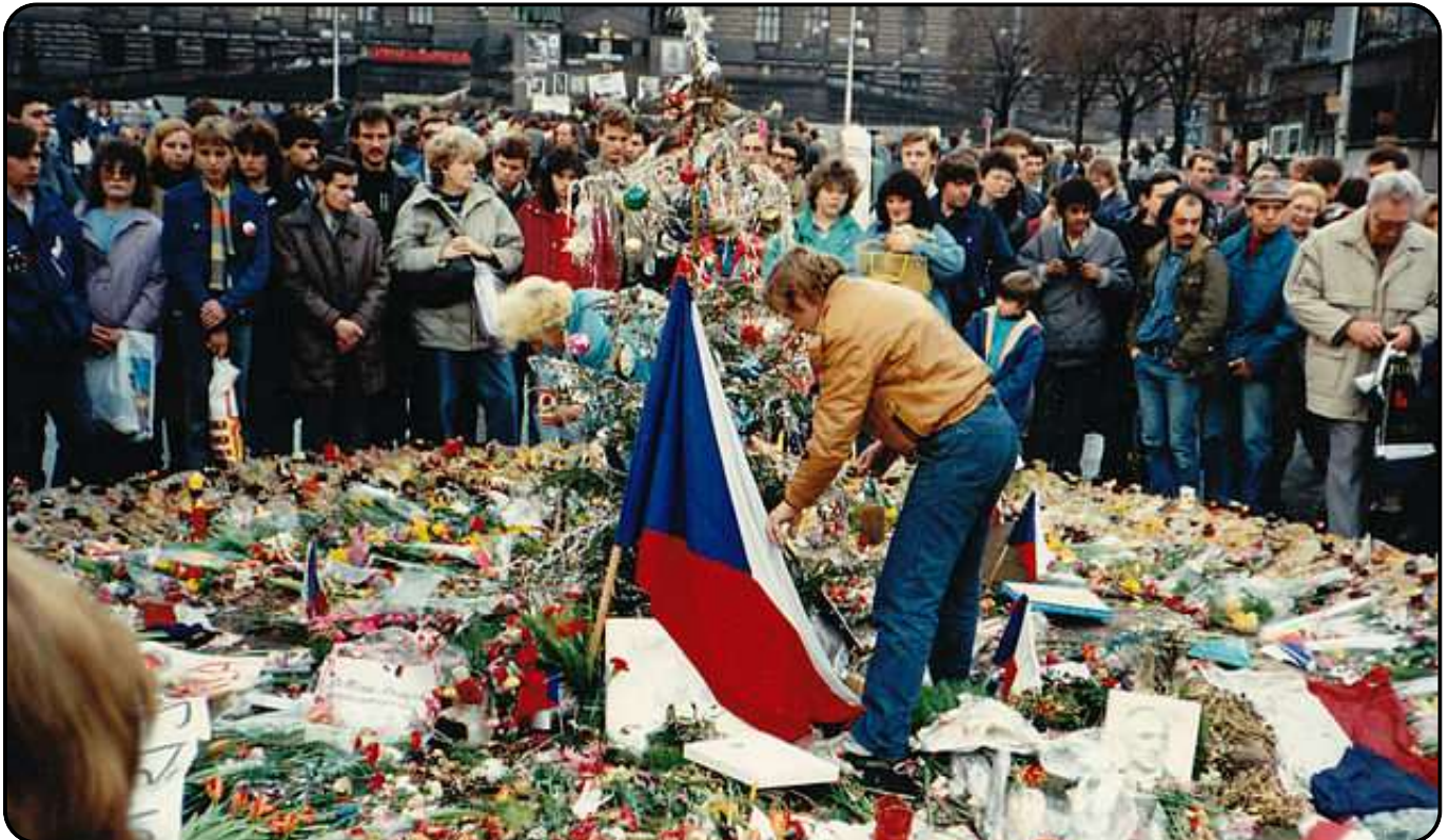
Vaclav Havel et des manifestants commémorent la lutte pour la liberté et la démocratie au mémorial de Prague lors de la révolution de velours de 1989.

Recevant un soutien international significatif, la Charte 77 se transforme rapidement en un organe semi-officiel d'opposition contre le KSČ par laquelle les intellectuels, via des bulletins d'informations, transmettent leurs opinions sur le pouvoir en place.