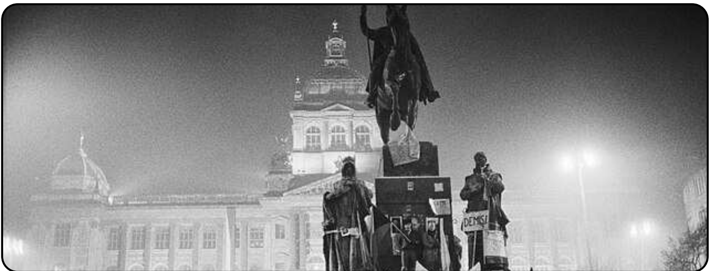
Manifestation nocturne, Novembre 1989, Prague

Il est surtout intéressant de faire un parallèle entre l'action de la Charte 77 à l'époque et des médias d'opposition aujourd'hui. Dans les deux cas, ils sont promoteurs d'opinions originales et permettent à la fois éveil des pensées et émancipation des raisons.